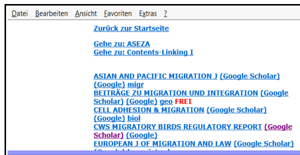
Abb. 5 Titelsuche nach migration

Durch Anklicken von Agrarwissenschaften im oberen Menu der Fachgebiete (Abb. 1) öffnet das Auswahlmenu der Themen (Abb. 2). Nach Auswahl von Agrartechnik öffnet die entsprechende Zeitschriftenanzeige (Abb. 3). Nach Klicken auf GoogleScholar des Titels Transport in porous media zeigt GoogleScholar alle in der Zeitschrift enthaltenen Artikel (Abb. 4). Abb. 5 zeigt das Ergebnis einer Titelsuche mit thematischen Hyperlinks u.a.