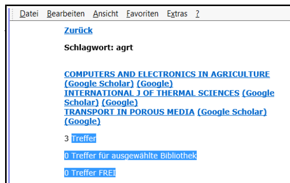
Abb. 3 Zeitschriften zu Agrartechnik